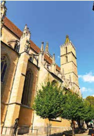
St. Jakob in Rothenburg o.d.T.

Die Fahrt entlang der Romantischen Straße wird von einem ortskundigen Reiseleiter begleitet, der Informationen über Land und Leute vermittelt (D/E). Ein Besichtigungsprogramm in Weikersheim und ein Fotostopp in Röttingen runden das Programm ab. Bei der Rückfahrt nach Frankfurt Fotostopp an der Residenz in Würzburg (UNESCO-Weltkulturerbe). Bei Fragen stehen die Reiseleiter den Gästen stets zur Verfügung.