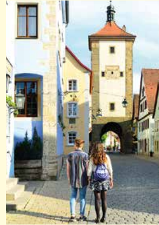
Plönlein in Rothenburg o.d.T.

Das Weinland Romantische Straße erstreckt sich von Würzburg bis Rothenburg o.d.T. Während der Fahrt entlang der Weinberge werden drei Erzeugnisse aus der Region gereicht, die im Bus gekostet werden können. Die Getränke werden in Flaschen serviert und können auch mit ins Gepäck genommen werden. Ein Besichtigungsprogramm in Weikersheim und ein Fotostopp in Röttingen runden das Programm ab. Bei der Rückfahrt nach Frankfurt Fotostopp an der Residenz in Würzburg (UNESCO-Weltkulturerbe). Versierte Reiseleiter (D/E, teilweise Japanisch) geben einen Einblick in die Geschichte und stehen bei Fragen zur Verfügung.