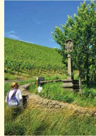
Weinberge bei Röttingen